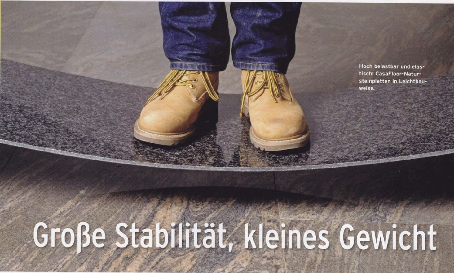
Hoch belastbar und elastisch: CasaFloor-Natursteinplatten in Leichtbauweise.