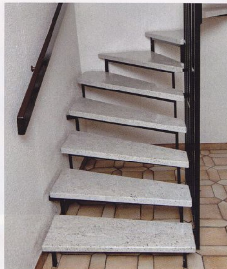
Leichtgewicht mit massiver Optik: Harfentreppe mit Granit-Light-Stufen von CasaFloor

Rohtafeln für Massiv- und Dünnstein sowie seit mehr als 20 Jahren Dünnsteinplatten ab 5 mm Stärke. Die Schwesterfirma Stonedil ist zuständig für den Vertrieb von Fassadenelementen mit 6 bis 7 mm dünnen Natursteinplatten.