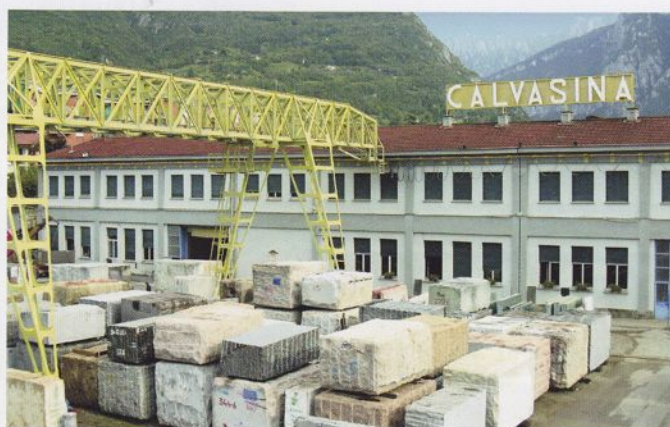
Die italienische Firma Calvasina liefert die Dünsteinplatten für CasaFloor.

Josef Anton Natursteine GmbH Hauptstraße 97a 63579 Freigericht-Altenmittlau Tel.: 06055/2181 Fax: 06055/900599 info@anton-natursteine.de www.anton-natursteine.de