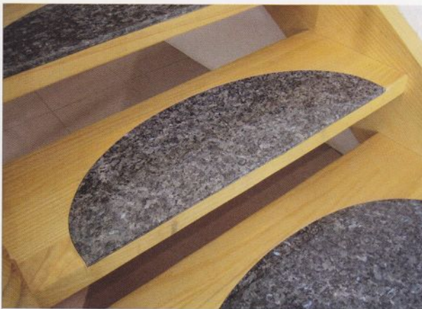
Holzterasse mit Einsatz aus CasaFloor