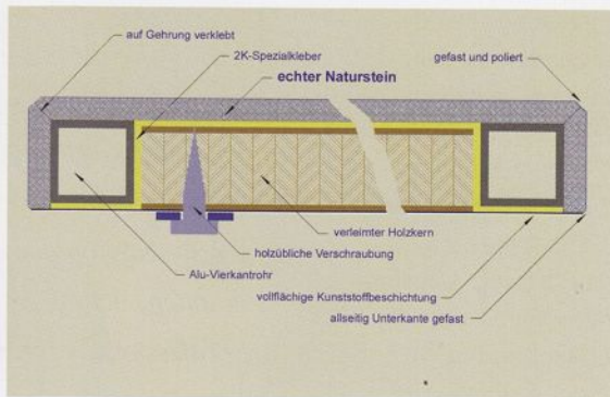
Querschnitt einer Granit-Light-Stufe

»Den Dünstein selbst haben wir zwar nicht erfunden«, sagt Josef Anton. »Dafür hat CasaFloor die professionelle Anwendung von Dünstein für einen breiten Markt entwickelt – mit allem erforderlichen Know-how und einer sehr hohen Endqualität.« Alle CasaFloor-Produkte werden nach der Devise »maximale Stabilität bei minimalem Gewicht« hergestellt. Die Hartgesteinplatten sind mit 8 mm +/- 0,5 mm sehr dünn. Hoch belastbar und einseitig hochelastisch werden sie durch den rückseitigen Verbund mit einem Glasfasergewebe. Der Kunde hat die